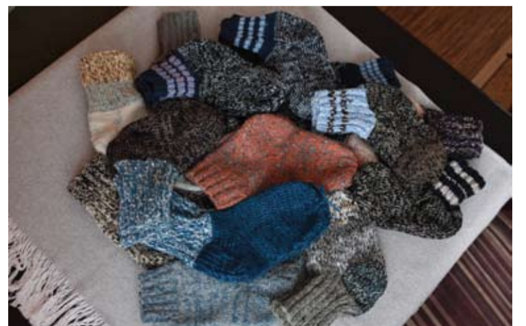
Šiltos kojinės Ukrainos kariams – viena iš pagalbos formų, keliaujančių tiesiai į frontą iš Anykščių.