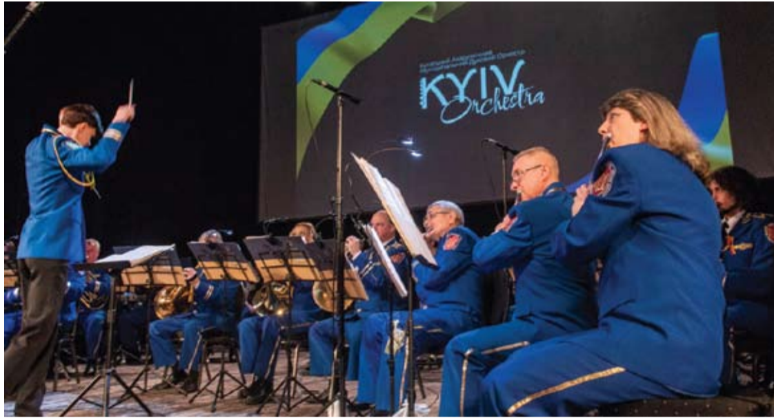
Kijevo akademinio pučiamųjų orkestro „Kyiv Orchestra“ padėkos koncertas prasidėjo Lietuvos ir Ukrainos himnais.

Anykštėnai ukrainiečius palaiko ir kitais būdais – į frontą siunčiamos mūsų rajono moterų megztos kojinės, neabejingų žmonių gamintos apkasų žvakės, maskuojamieji tinklai, aukoja anykštėnai ir pinigine forma.