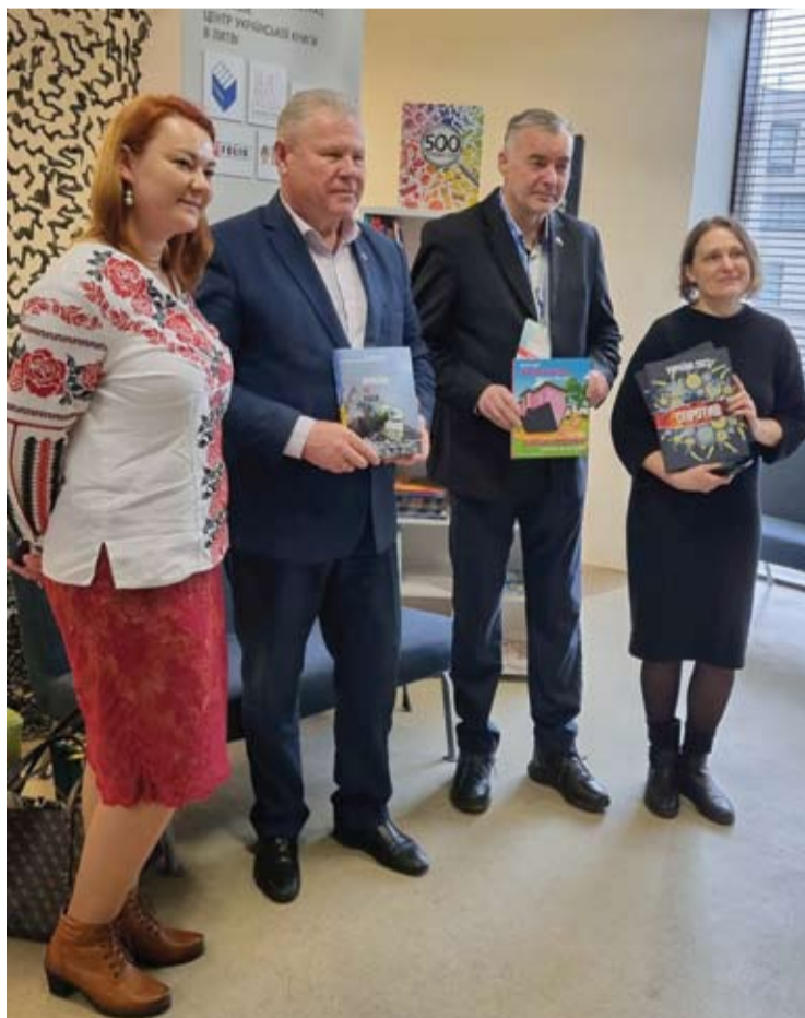
Praėjusią savaitę Anykščių L. ir S. Didžiulių viešojoje bibliotekoje jau ne pirmą kartą lankėsi Ukrainos leidėjai dovanoti knygas.

„Jie turi darbus, papildomas veiklas, bet jie labai noriai įsitraukė į paramos Ukrainai teikimą. Jie labai drąsiai įsitraukia ir į mūsų šventes, mūsų kultūrą. Nežinau, kaip kitur, bet Anykščiuo-